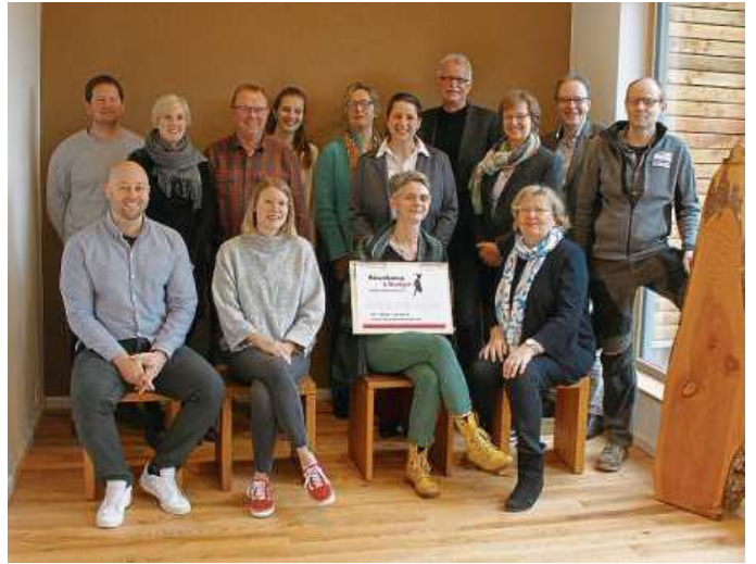
Im Frühjahr entstand dieses Bild der Gruppe 2 mit weiteren Unternehmensvertretern aus dem Münsterland. Auch deren Unternehmen tragen jetzt den Titel „CSR-Unternehmen Münsterland“.