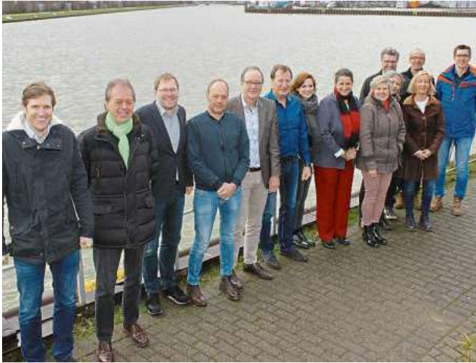
Am Hafen in Münster trafen sich unter anderem die Unternehmensvertreter der Gruppe 1, um gemeinsam mit Experten über CSR zu sprechen und Pläne zu schmieden.